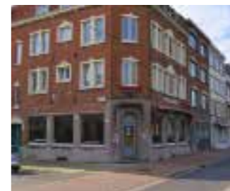
Dokter Eduard Moreauxlaan